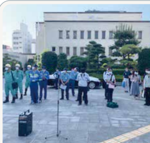
□ 松山市違反広告物一斉撤去活動