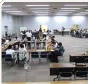
□ 愛媛県屋外広告官民連絡会議参加