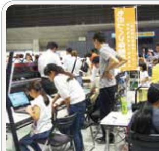
□ えひめものづくりフェア参加